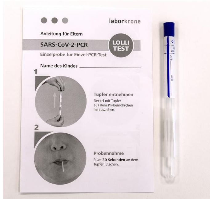
2) Veranlassung der Einzeltests (siehe Anleitung für Eltern)