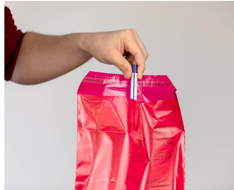
3) Sammeln der Einzeltests

Videoanleitung für Eltern https://www.youtube.com/watch?v=RAbzRSWGVcE